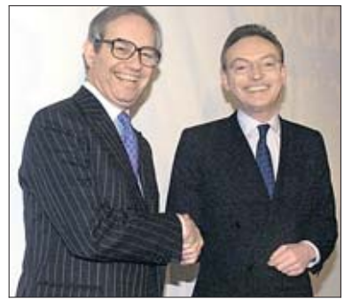
Seine Abfindung löste eine Debatte aus: Ex-Mannesmann-Chef Klaus Esser (r.)