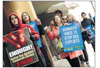
Proteste gegen Millionen-Boni des schiechen US-Versicherungskonzerns AIG