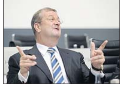
Ex-Porsche-Chef Wendelin Wiedeking: Verdiente 2007/2008 fast 80 Mio. Euro